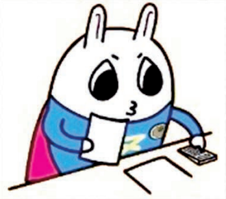
東京地方税理士会 イメージキャラクターの「トッチーくん」